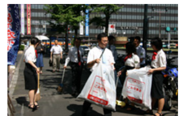
(皆様の温かいご支援の下に10回目を迎え、「小さな親切」実行章を受賞した武富士クリーン運動)

報告書においては CSR への取り組み方針を始めとして、コンプライアンス体制や社会貢献活動、環境保護活動及び情報開示への取り組みなどについてご照会しております。今後も武富士らしい地域に密着した CSR 活動を通じて企業の社会的責任を果たすと共に、お客様、株主の皆様、お取引先並びに地域社会など、ステークホルダーとの関係に一層配慮した、より透明性の高い CSR 経営を実践して行く所存です。